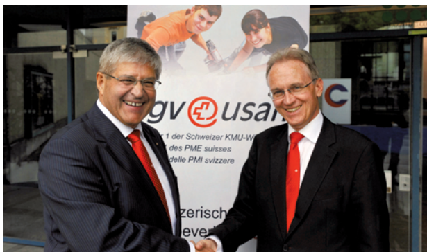
Bruno Zuppiger Conseiller national / Président usam