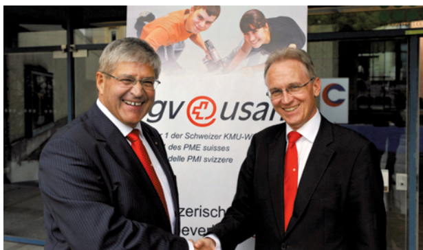
NR Bruno Zuppiger Präsident sgv