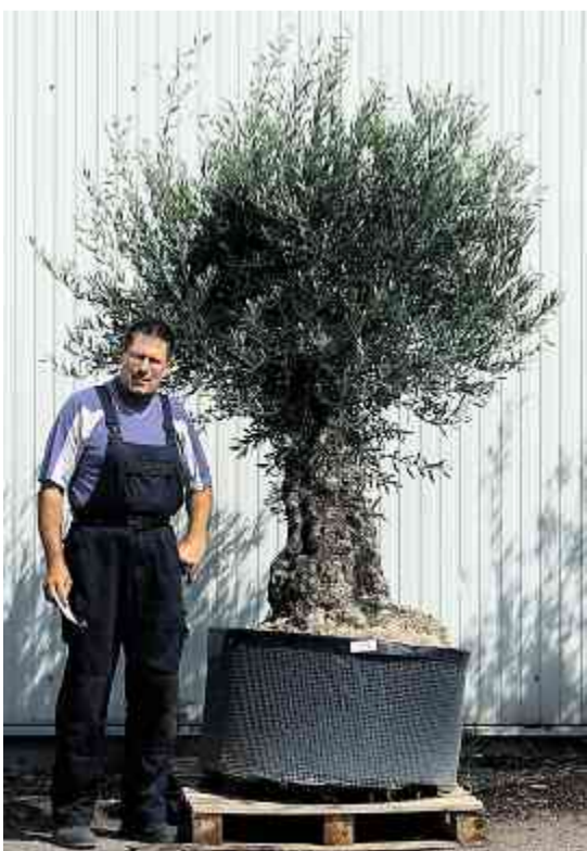
Ohne Olivenbaum geht nichts: Bei spezialisierten Gartenbaubetrieben kann man die «Symbole des Südens» sogar mieten.