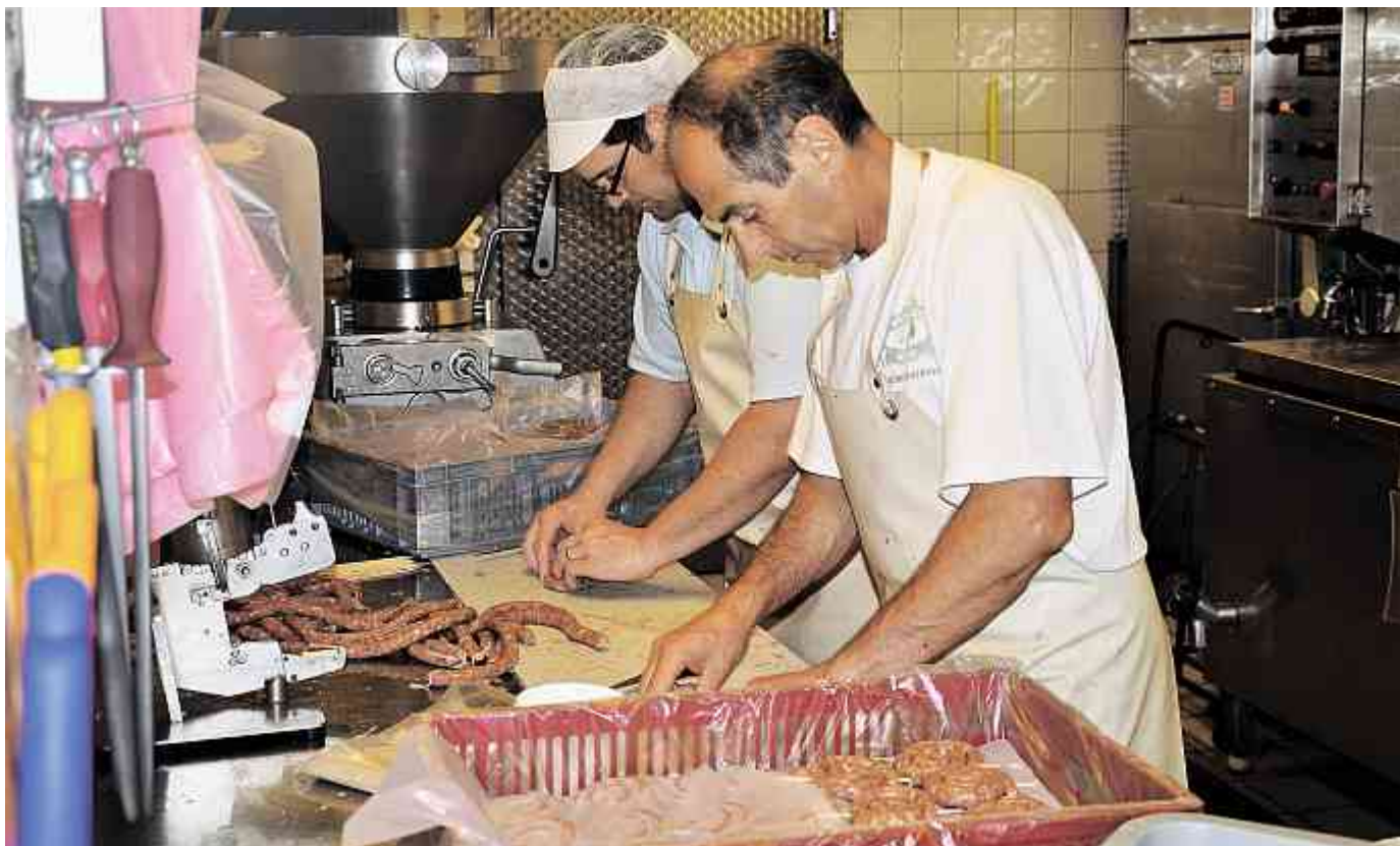
Die eigentliche Kunst des Metzgerhandwerks ist das Wurst.