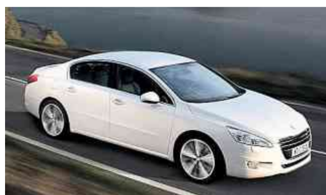
Edel, kraftvoll und öko-verträglich: der neue Peugeot 508.

Das Motorenprogramm bestimmen die von der Marke bekannten dreh-