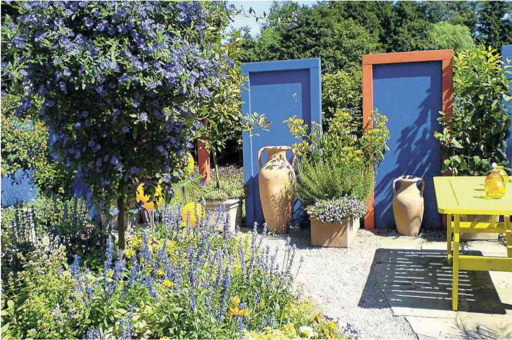
Voll im Trend: Mediterran inspirierte Gärten und Terrassen findet man immer häufiger auch nördlich der Alpen.