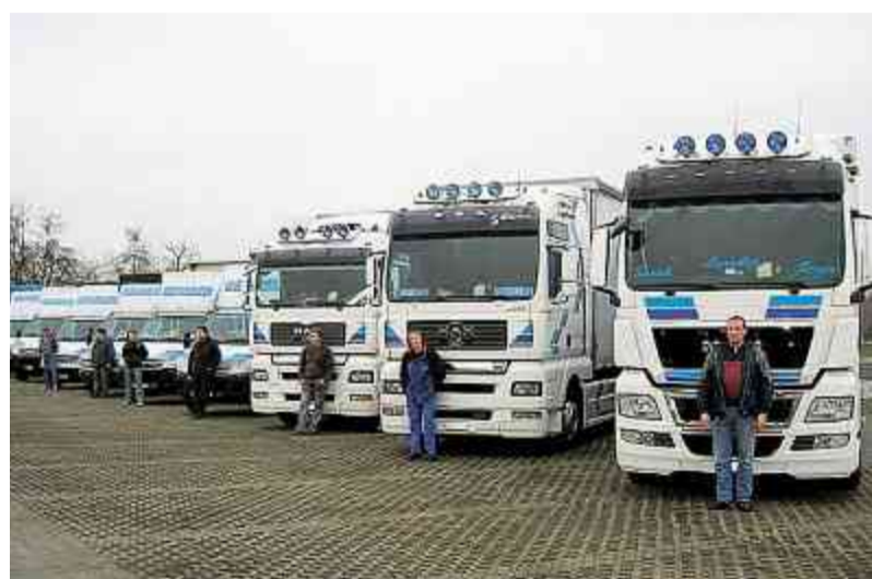
Die Schweizer Transporteure modernisieren ständig ihre Flotten – und lösen damit ungewollt LSVA-Erhöhen aus.

Die Erkenntnisse des Bundes zeigen aber auch, dass der Anteil der schweren Nutzfahrzeuge in der neuesten Emissionsklasse der EURO-Norm 5 am gesamten Fuhrpark von 18,7 (2008) auf 25,7 (2009) Prozent erneut kräftig angestiegen ist; bei der Fahrleistung stieg ihr Anteil sogar von 24,3 auf 37,5 Prozent. Zugleich gingen Anzahl und Fahrleistungen von älteren Fahrzeugen der EURO-Normen 1 und 2 weiter zurück. Inzwischen werden über 87 Prozent aller gefahrenen Kilometer mit äusserst umweltverträglichen Nutzfahrzeugen der EURO-Normen 3 bis 5 zurückgelegt. Für den Astag-Zentralpräsidenten Nationalrat Adrian Amstutz ist