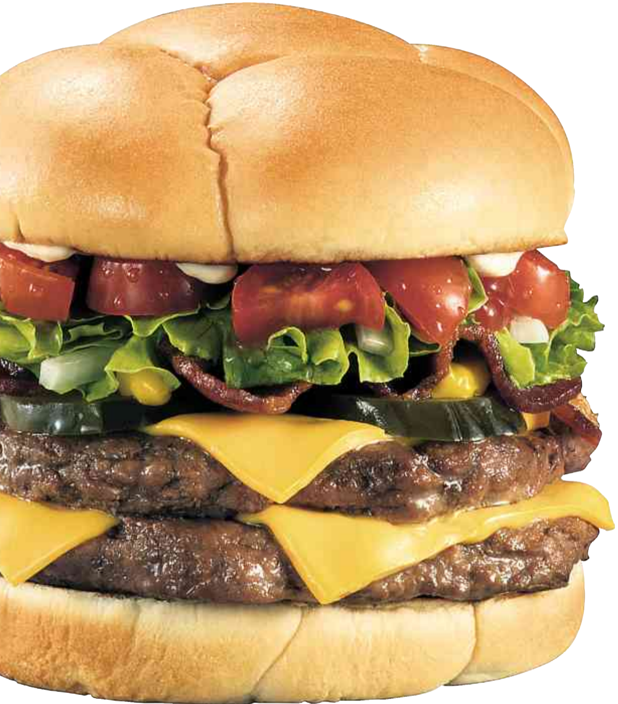
Müssen die mündigen Bürgerinnen und Bürger vor den Kalorien im Burger geschützt werden?

Allein zum Stichwort «Übergewicht» finden sich in der Curia Vista, der Geschäftsdatenbank des eidgenössischen Parlaments, 38 Treffer. Zum Beispiel – willkürlich herausgegriffen – einer des Berner Grünen Alec von Graffenried. Er macht sich Sorgen um die Männergesundheit und findet, dass angesichts von Phänomenen wie Übergewicht, Stress oder hoher Alkoholkonsum unter Männern gezielte Massnahmen und Informationskam-