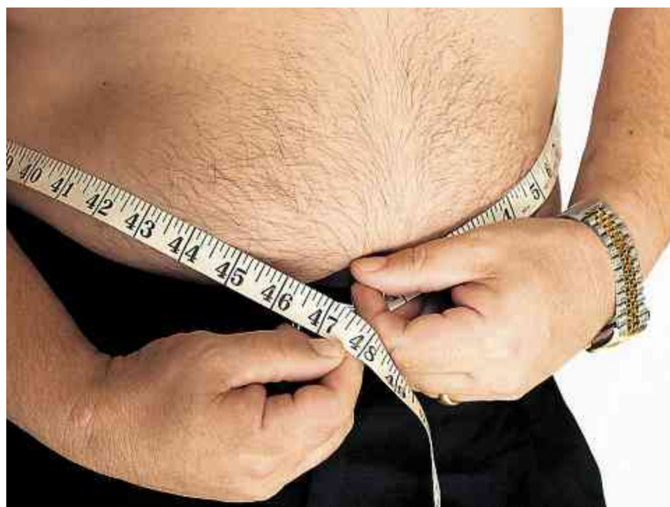
Das Körpergewicht ist eine Privatsache – oder?

Es geht bei der Verreglementierung des Privaten also schlichtweg um Macht. Um neue politische Gestaltungsmöglichkeiten für den Staat und damit letztlich um den Abbau