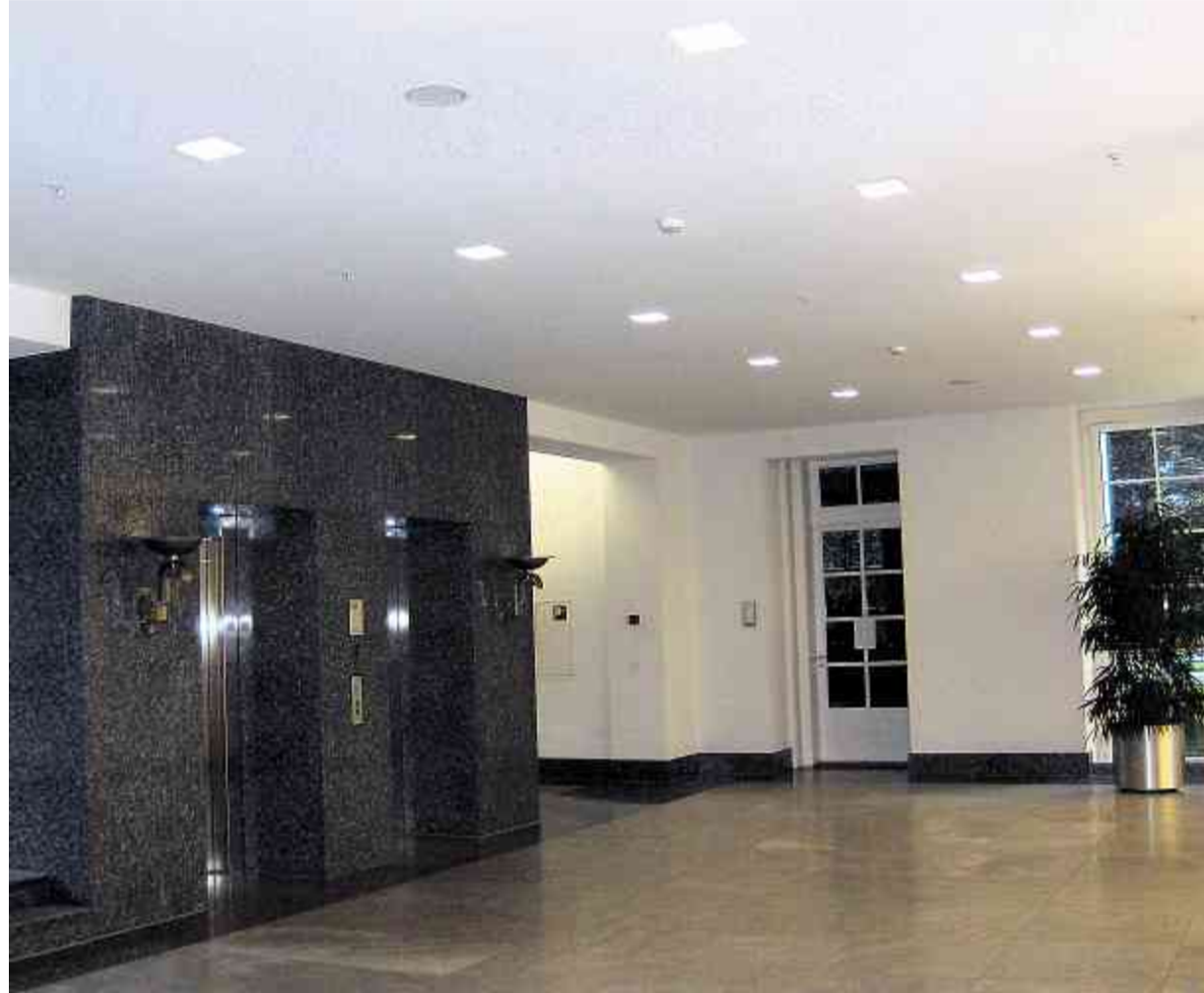
Die AXA Winterthur spart mit ihrer neuen Lichtlösung 70 Prozent der Stromkosten.