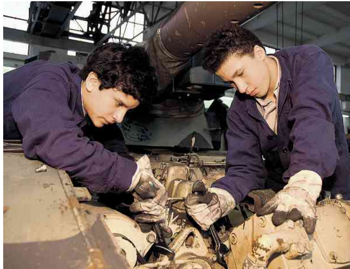
Immer mehr Arbeit für den Nachwuchs: Die Jugendarbeitslosenquote ist seit Monaten am Sinken.

Der aktuelle Beschäftigungsausblick der Organisation für wirtschaftliche Zusammenarbeit und Entwicklung (OECD) stellt unserem Land ein beneidenswertes Zeugnis aus. So ist in der Schweiz die Arbeitslosigkeit zwischen dem ersten Quartal 2008 und ersten Quartal 2010 von 3,5 auf 4,5 Prozent der Erwerbsbevölkerung gestiegen. Im gesamten OECD-Raum stieg die Arbeitslosenquote im gleichen Zeitraum hingegen von 5,7 auf 8,7 Prozent.