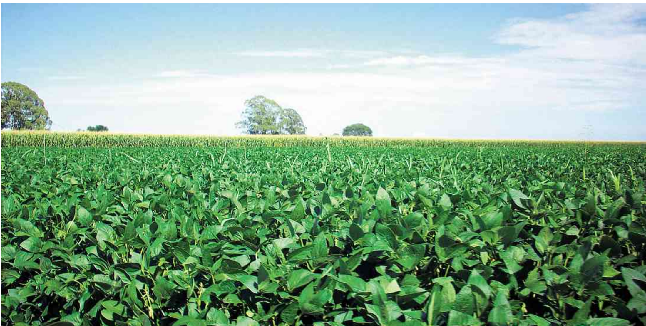
Sojaanbau in Brasilien: Der heutige Schweizer Futtermittelimport erfordert eine Ackerfläche, die praktisch derjenigen der Schweiz entspricht.

bürgerlicher Freiheiten. Nicht umsonst musste ich mir kürzlich von einem erstaunten chinesischen Diplomaten, der erst einige Monate in der Schweiz ist, sagen lassen, die persönlichen Freiheiten seien mittlerweile in der Volksrepublik China schon grösser als in der Schweiz, denken Sie etwa an die Ladenöffnungszeiten.