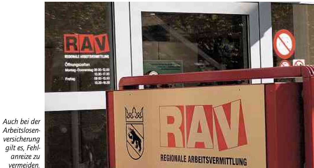
Auch bei der Arbeitslosenversicherung gilt es, Fehlanreize zu vermeiden.

Die kommende Abstimmung über die Revision der Arbeitslosenversicherung im September wird zeigen, ob die Mehrheit der Stimmbürgerinnen und Stimmbürger für einen bescheidenen Paradigmenwechsel eintreten will, nämlich indem sie einer Vorlage zustimmt, die neben einer Erhöhung der Beiträge um 0,2 Prozent auch auf der Leistungsseite einige bescheidene Korrekturen vornehmen und verschiedene Fehlanreize beseitigen will.