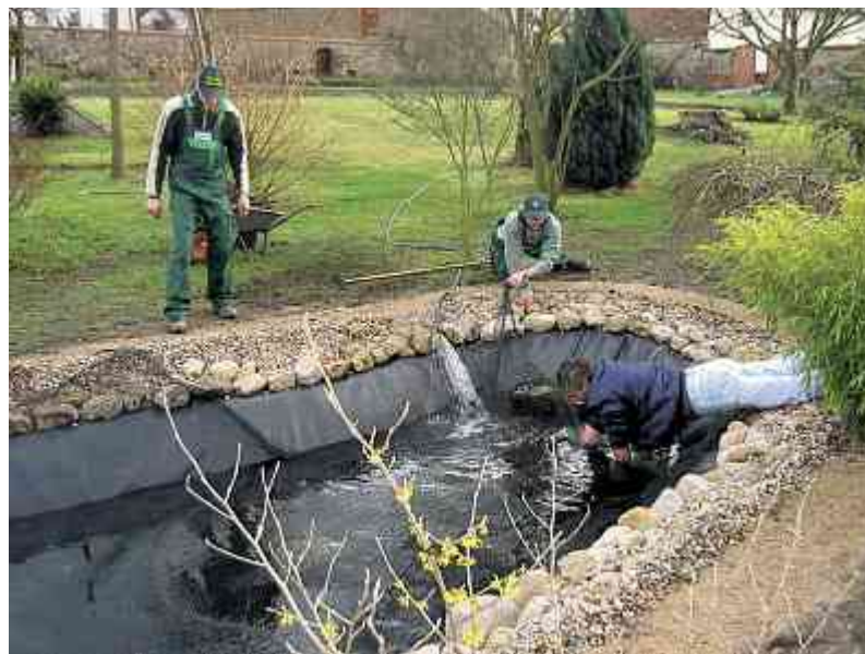
Nicht nur die Landschaftsgärtner brauchen Aufträge von den «Grossen»: Die KMU sind darauf angewiesen, dass im ganzen Baugewerbe Bietergemeinschaften akzeptiert werden.

Der Schweizerische Baumeisterverband (SBV) und der Fachverband infra haben schon zu viele von den oben angesprochenen Fällen erlebt, deshalb haben sie kürzlich eine Broschüre zum Thema öffentliches Beschaffungswesen herausgegeben. «Zielführende Ausschreibungen und faire Vergaben» fasst die Standpunkte in zehn Postulaten zusammen. Das erste ist «Der Bauherr muss wissen, was und wie er bauen will». Was sich logisch anhört wird, in Praxis oft vernachlässigt. Arbeiten, die erst