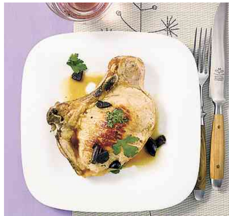
Das Metzgereigewerbe würde es nicht freuen, wenn Schweizer Schweinskoteletten nicht mehr als Schweizer Produkt verkauft werden dürften...