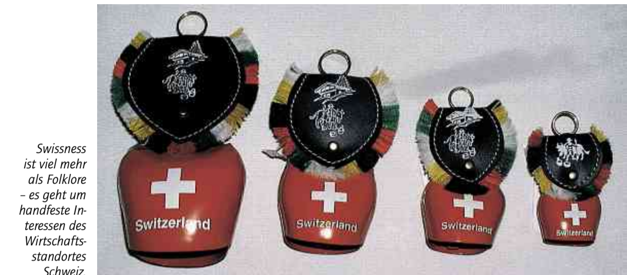
Swissness ist viel mehr als Folklore – es geht um handfeste Interessen des Wirtschaftsstandortes Schweiz.

Mit der Zielsetzung des Swissness-Projekts – nachhaltige Sicherung und langfristige Erhaltung des Mehrwerts des Labels «Schweiz» und damit Stärkung der Marke Schweiz – ist der sgv zwar einverstanden. Ebenso mit der Notwendigkeit, Missbräuche konsequent zu bekämpfen und das Wappenschutzgesetz so zu ändern, dass neu die Verwendung des Schweizer Kreuzes auch auf Produkten erlaubt ist. Die komplizierten und verschärften Regeln zur Erlangung der «Swiss-