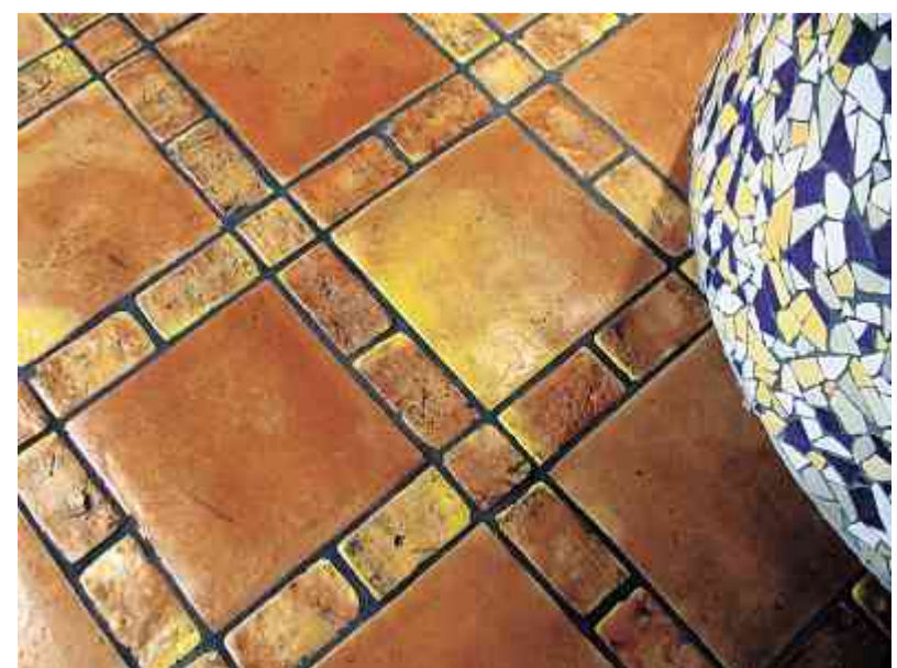
Terracotta mia: Warme, erdige Farbtöne sind nicht nur als Bodenbelag «in».