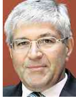
Nationalrat Bruno Zuppiger, Präsident Schweizerische Gewerbeverband sgv

Für insgesamt vier Sozialwerke werden allein auf das kommende Jahr hin höhere Steuern, Prämien oder Lohnabzüge im Umfang von sage und schreibe zirka 3,5 bis 4,5 Milliarden Franken nötig. Dazu gehört erstens die Schuldentilgung der IV mit 0,4 Mehrwertsteuerprozentpunkten oder etwa 1,2 Milliarden Fran-