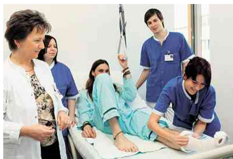
Die gewerblichen Grundausbildungen erhalten immer mehr Konkurrenz - nicht zuletzt wegen des Riesenmangels an Pflegepersonal.

Die Kantone begegnen den genannten Tendenzen mit gezieltem Lehrstellenmarketing, Lehrstellennachweisen, Brückenangeboten und individueller Begleitung von Jugendlichen (etwa Case Management Berufsbildung). Kurz vor den Sommerferien unternahmen sie zusätzliche Anstrengungen, um in Spezialprojekten